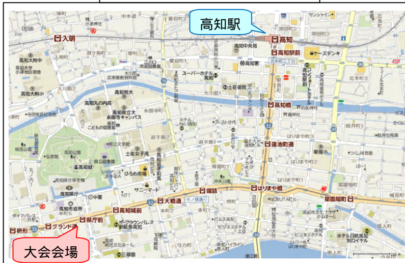
大会会場および高知駅周辺地図