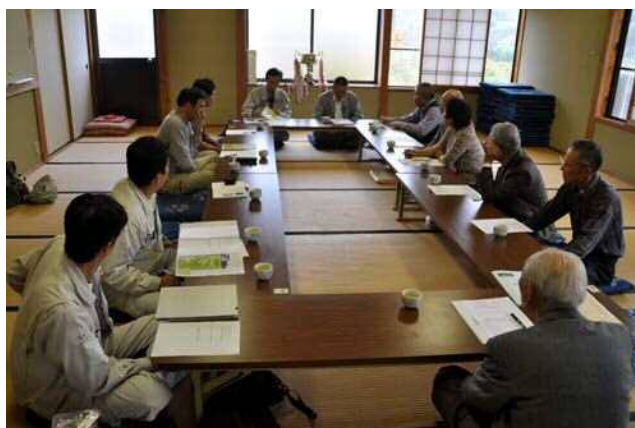
写真一5、地元代表者との懇談会