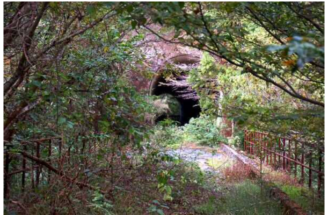
写真－3、放置された橋梁とトンネル

トンネルは山の中では入口が閉鎖されることもなく虚ろに坑口を空けていたり、例え閉鎖されていても、入口の柵は朽ちて荒れ放題になっていた。それでもトンネルの巻き立てのコンクリートの劣化はほとんどなく、危険な箇所はなかつた。