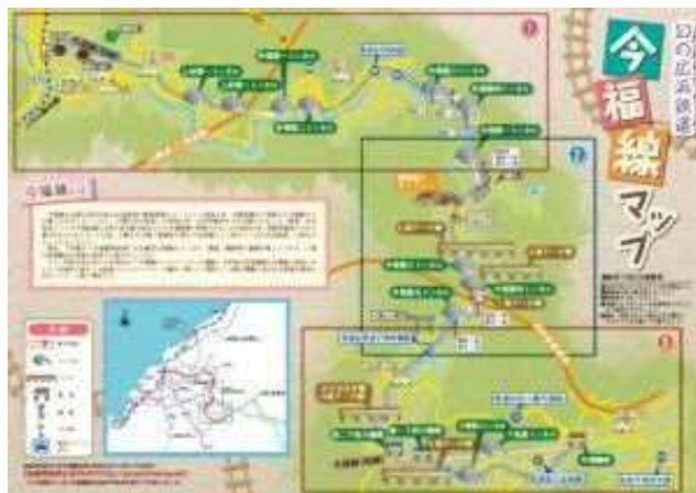
写真一七、今福線マップ

分科会活動が続けている間に、世間には鉄道の廃線マニアあるいは未成線マニアといわれる人々がいて、今福線の現場にもこうした人々が時々訪れていることがわかった。ところが他所の路線とは違って、今福線では公開されている地図はほとんどないため、訪れる人々には非常に不便であることがわかった。