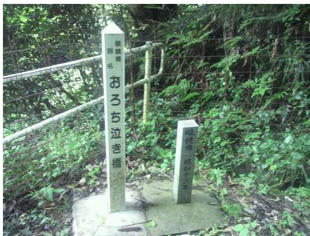
写真一6、設置された標柱