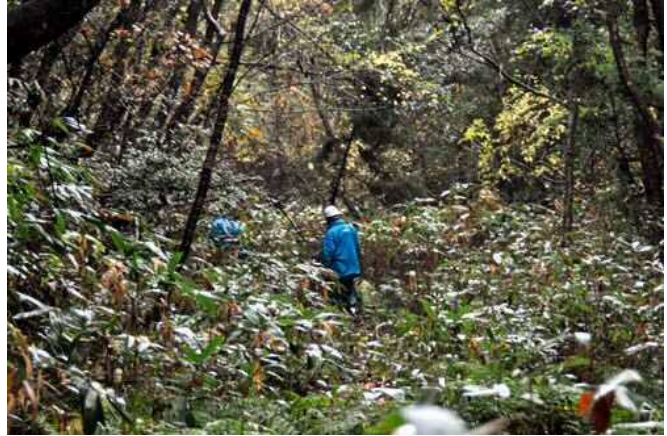
写真－2、藪になっている路線敷

初年度以降にも、必要に応じて予備調査を行い、毎回、それまでに行っていない区間を選んで踏査した。現場は数十年に渡って人々から忘れられ放置されたままになっており、路線敷には雑木が生い茂り、ナタで切り開きながら行かなければならないところもかなり多く踏査には時間がかかった。