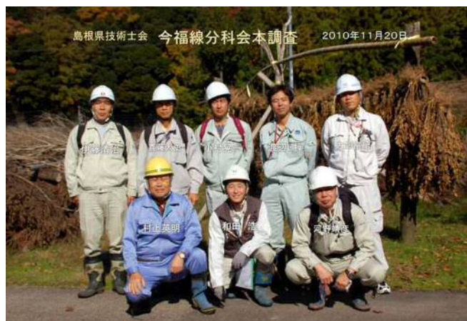
写真-1、 第一回本調査メンバー

最初の予備調査は、2010年(平成22年)10月23日に4名で、本調査は同年11月20日に8名で行った。予備調査は地元の会員が日帰り、本調査は会員のほとんどが参加して