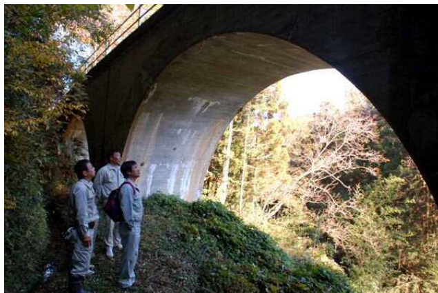
写真一4、おろち鳴きを発見

こうしていよいよ我々の分科会と地元との共同が始まり、現在まで途絶えることなく続いているのである。