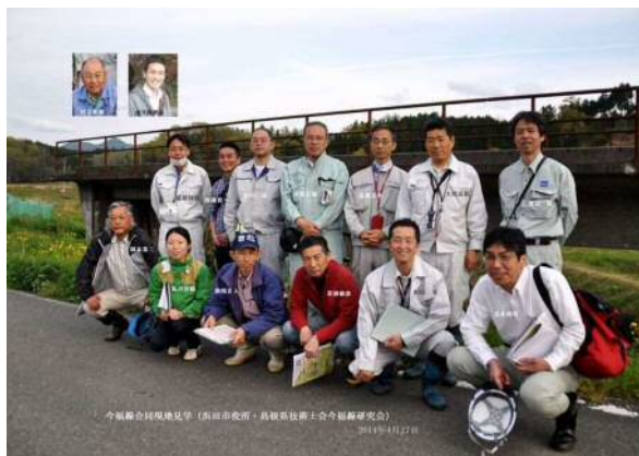
写真—8、浜田市・地元との現地検討会