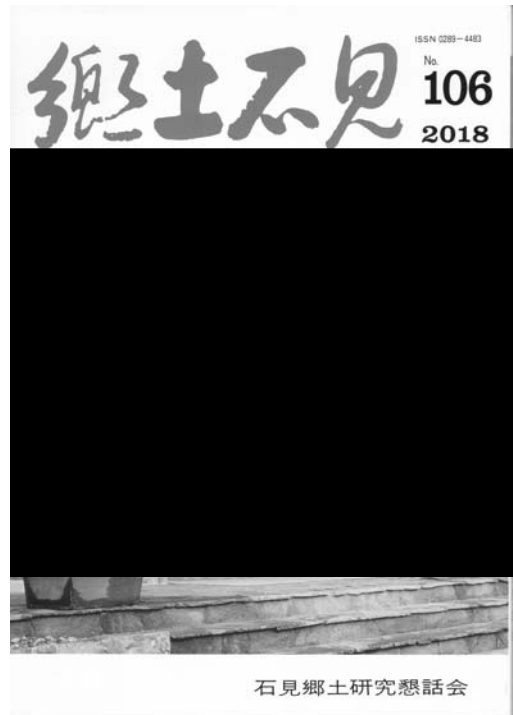
写真－8、郷土誌「郷土石見」表紙

今後も今福線研究分科会のメンバーか ら執筆者を変えて、視点の異なる記事を連載することになっている。