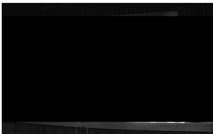
写真-1、サミットのパネルディスカッション

フォーラムに続いて五新線の現地見学、翌5日には木レールというイベントが開催されて家族連れで1000人の参加があった。これは五新線の遺構上に小さなレールを延長500mに渡って設置し、その上をそれぞれが持参したミニ列車を走らせるイベント（持参していない人はスタート地点で数百円からミニ列車