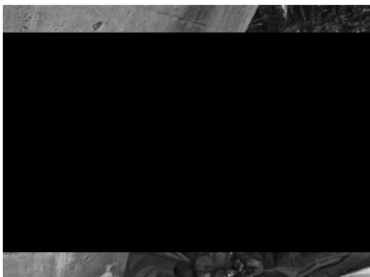
写真－6、RC レーダーによる調査

RC レーダーにより鉄筋の有無を調べ、シュミットハンマーによってコンクリートの強度測定を行った。