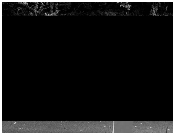
写真-5、ドローンを迎える参加者