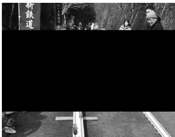
写真-3、木レール会場の盛況