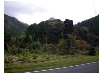
写真. 10 旧線橋脚