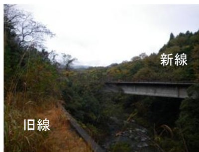
写真. 3 新線と旧線の分岐点

今年度から参加した私にとって、鉄道遺構は新鮮であり、その数の多さに圧倒されました。