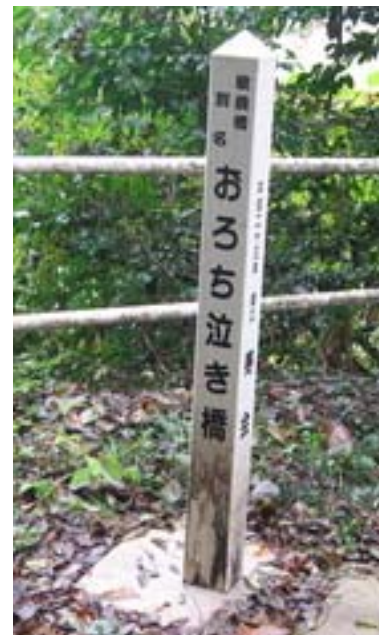
写真.1 「おろち泣き橋」碑