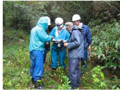
写真.2 現在地確認中