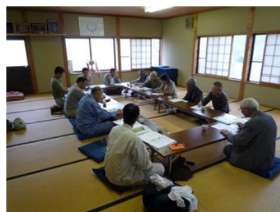
写真. 11 地元交流会