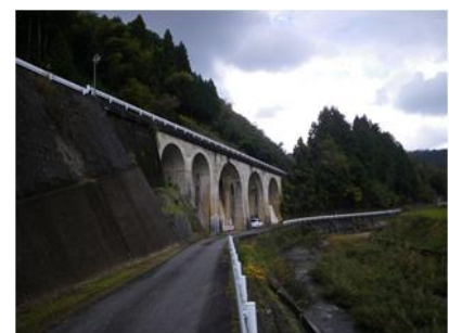
写真. 8 5連アーチ橋