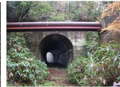
写真. 6 今福第六トンネル