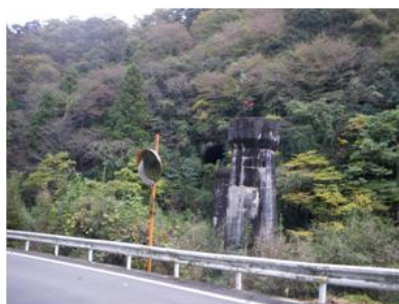
写真. 9 旧線橋脚とトンネル