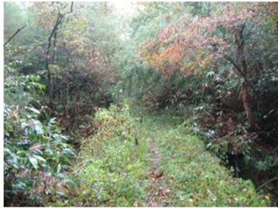
写真.1 カマとナタを持ち藪へ