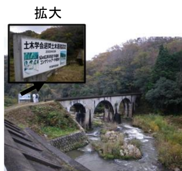
写真. 7 アーチ橋と土木遺産認定看板