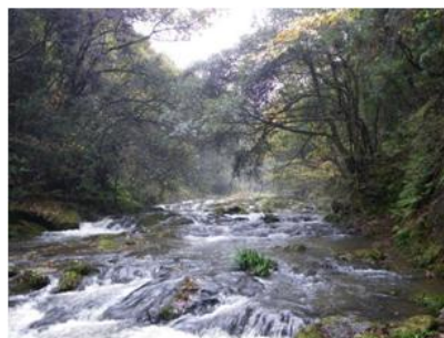
写真. 5 アーチ橋下の溪流