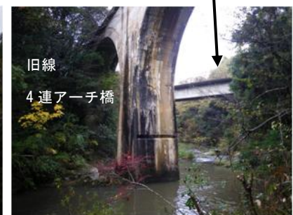
写真. 4 新線と旧線