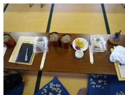
写真. 12 ごちそう