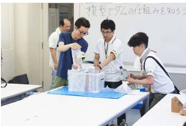
【写真5 ダム模型説明状況】