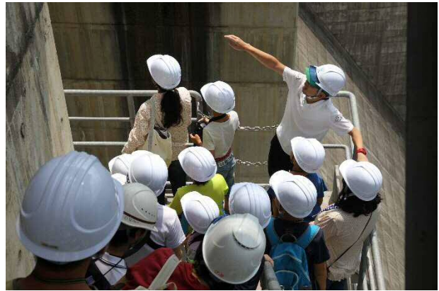
【写真2 尾原ダム見学】 段入れない放流ゲートを特別に見学