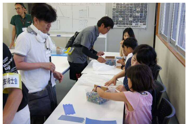
【写真6 ダム模型作成】