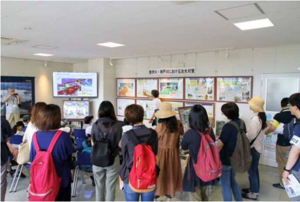
【写真1 尾原ダム見学】 事務所での説明状況