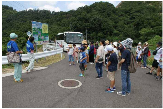
【写真4 三成ダム見学】